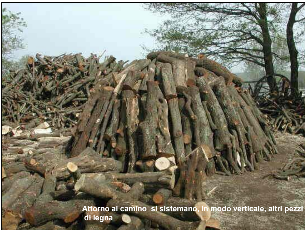
Attorno al camino si sistemano, in modo verticale, altri pezzi di legna