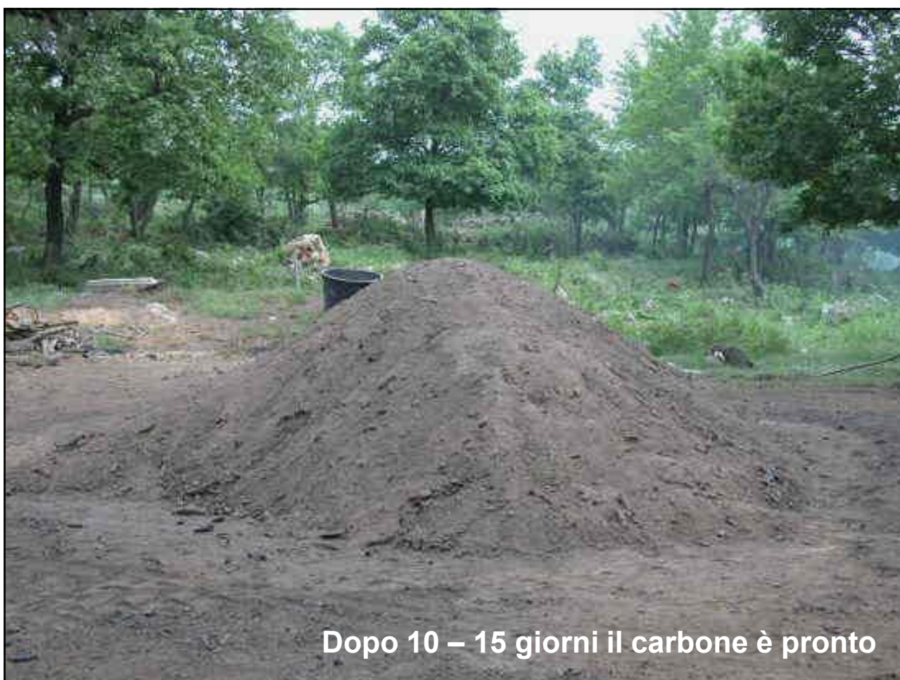
Dopo 10 – 15 giorni il carbone è pronto