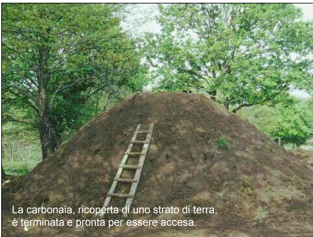
La carbonaia, ricoperta di uno strato di terra, è terminata e pronta per essere accesa.