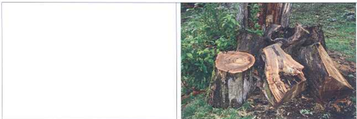
Proposta per un sedile di sasso