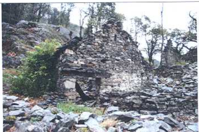
Rudere di stalla: conservazione passiva

La selva fra Curzùt e Puncéte, per la quale è in fase esecutiva il progetto di ripristino, si sviluppa su una costa a ripiani naturali e a tratti terrazzata, con tracce di muri a secco e ruderi rurali sparsi come il Piano delle Rogge.