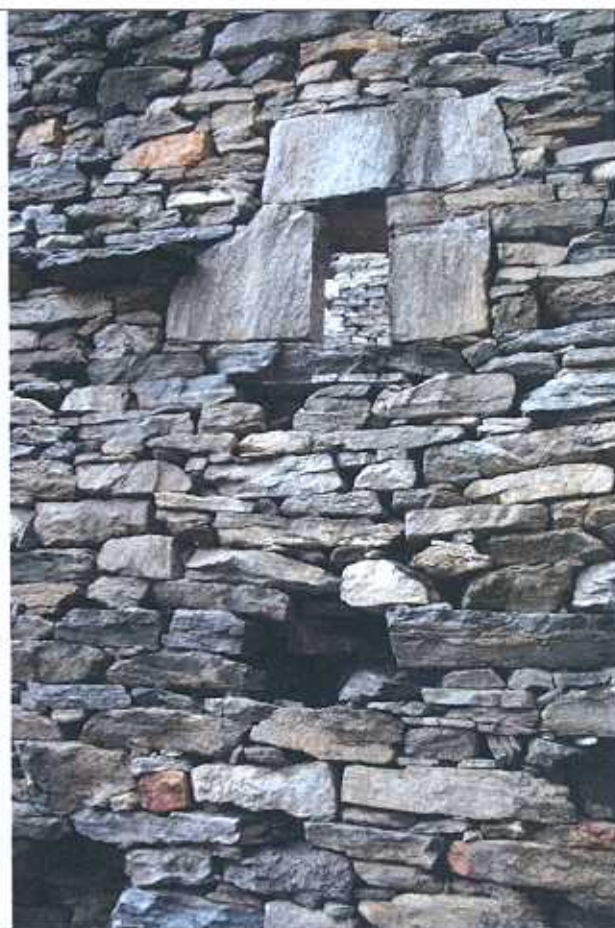
Ruderi alti da consolidare