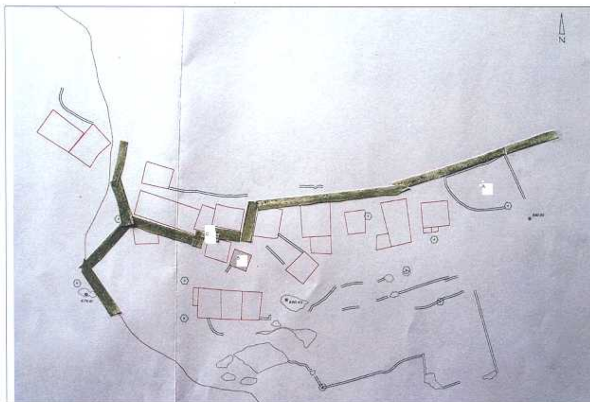
Piantina del sito archeologico con