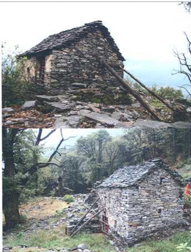
Grà o metato da restaurare